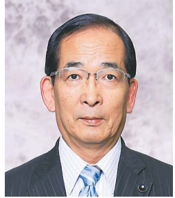
佐々木 俊雄 北海道議会議員