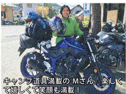
中々シブ道具満載のMさん。楽しくて嬉しくて笑顔も満載!

「ベージュが可愛いわね」 「はい。とっても美味い いですよ」。ドゥカティ 900のお父さんのタンデ ムシートに乗ってやってき た小学校6年生のAちゃん。 その満面の笑みと言っ たらもうくたまりません。 「お帰らないよ」福岡の 中学生の少女は、お父さん と一緒に時々やってきます が、会う度に大人になって いくのでドキドキ。なんだ か孫が沢山来たよう。連 休はいろんな家族像に触れ られるし、普段会えない人 にも再会できるので、まる で玉手箱開けたようで楽し かった。