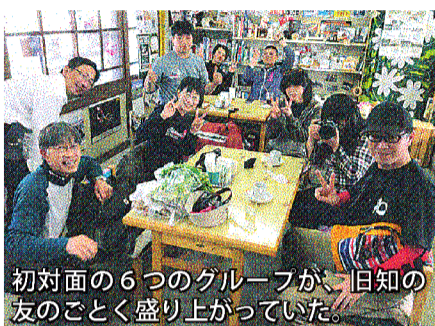
初対面の6つのグループが、旧知の友のごとく盛り上がっていた。