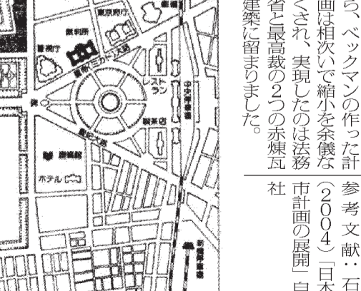
図 ベックマンの日比谷官庁集中計画 (出典:石田(2004))

蔵大輔時代に銀座煉瓦街を 熱心に進めた当事者でもあ りました。井上が洋行時に 目にしたのはオスマンのパ リ、これに強い影響を受け て、大蔵大輔時代には銀座 煉瓦街計画を熱心に進め、 また一方では鹿鳴館の建設 に力を注ぎます。続いて井 上は、これら一連の欧化政 策の集大成として、官庁を 鹿鳴館に近い日比谷に集中 させることを計画し、プロ シア(現・ドイツ)から建 築顧問官として、ヘルマ ン・エンデとウィルヘルム・ ベックマンを招聘し、技術 的な指導を仰ぎました。 明治19(1886)年に 来日したベックマンは、築 地本願寺から霞ヶ関を結ん だ風景を帝都景観の軸線と してふさわしいと決定し、