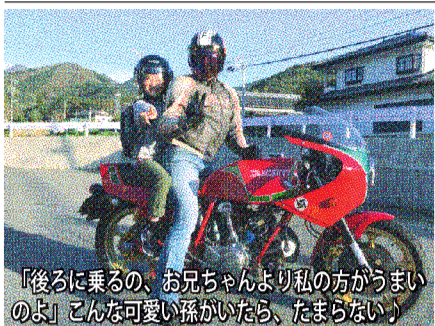
「後ろに乗るの、お兄ちゃんより私の方がうまいのよ」こんな可愛い孫がいたら、たまらない!

NETWORK NETWORK NETWORK NETWORK NETWORK NETWORK NETWORK NETWORK NETWORK NETWORK NETWORK