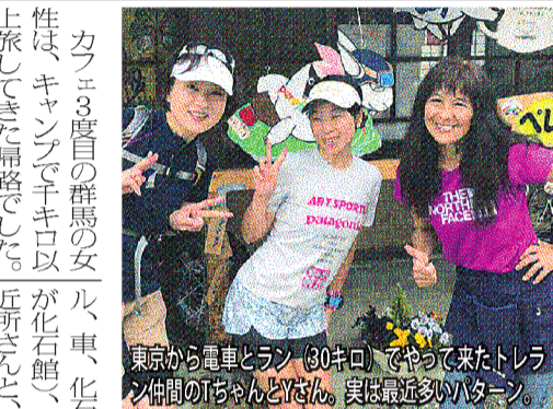
東京から電車とラン(30キロ)でやって来たトレラン仲間の人ちゃんとYさん。実は最近多いパターン。