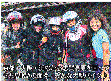
京都・大阪・浜松から志賀高原を回ってきたWIMAの面々。みんな大型バイク。