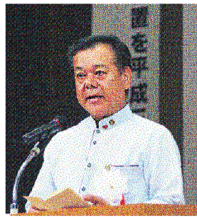
沖縄県南城市市長