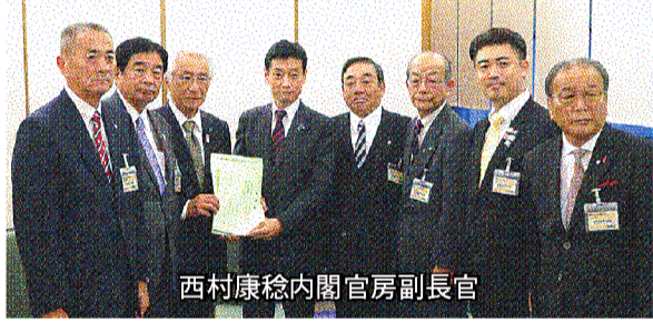
西村康稔内閣官房副長官