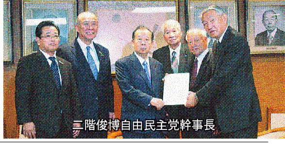
二階俊博自由民主党幹事長