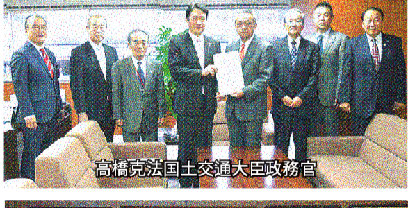
高橋克法国土交通大臣政務官