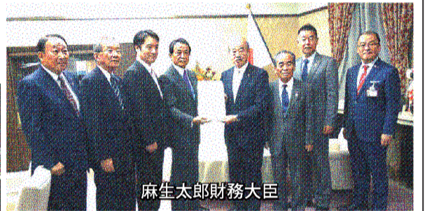
麻生太郎財務大臣