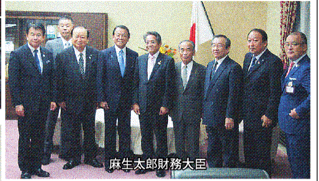
麻生太郎財務大臣