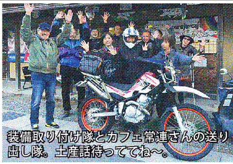
装備取り付け隊とカフェ常連さんの送り出し隊。土産話待っててね〜。

ふと思いつき、大阪・兵庫・岡山・香川にツーリングに行ってきた。一言で表すならば、「御礼廻りの旅」。一年前に仲間の手を借りて私の元へやってきた通称「パリダカ子」(1997年にパリダカを