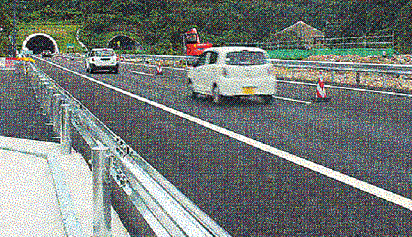
車線規制して最終工事中の高松自動車道。初めて通る高速はワクワク。