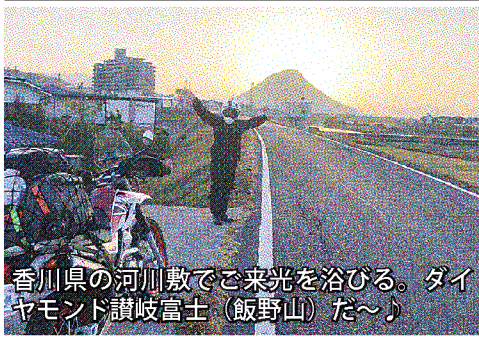
香川県の河川敷で来光を浴びる。ダイヤモンド讃岐富士(飯野山)た〜♪

NETWORK NETWORK NETWORK NETWORK NETWORK NETWORK NETWORK NETWORK NETWORK NETWORK NETWORK