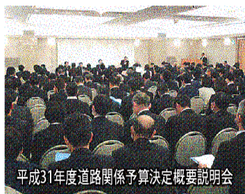
平成31年度道路関係予算決定概要説明会