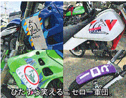
ひたすら笑えるニセロー軍団。