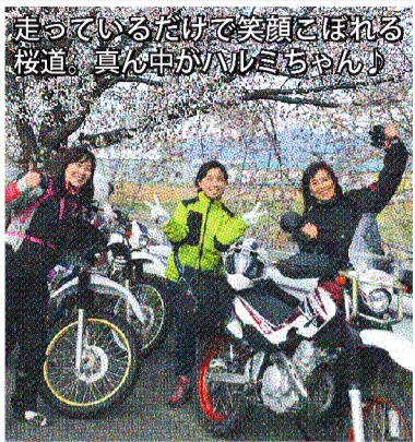
三好礼子 エッセイスト・元国際ラリースト ～http://www.fairytale.jp/～