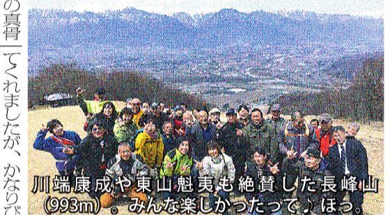
川端康成や東山魁夷も絶賛した長峰山(993m)。みんな楽しかったって、ほっ。

「欲しい」の願いが叶った昨年末から毎日楽しんでいますが、いよいよ春到来という訳で、さっそくツーリングを企画しました。本家のヤマハでは「セローミーティング」なる公式イベント