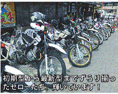
初期型から最新型までずり揃ったセローたち。輝いています！

NETWORK NETWORK NETWORK NETWORK NETWORK NETWORK NETWORK NETWORK NETWORK NETWORK NETWORK