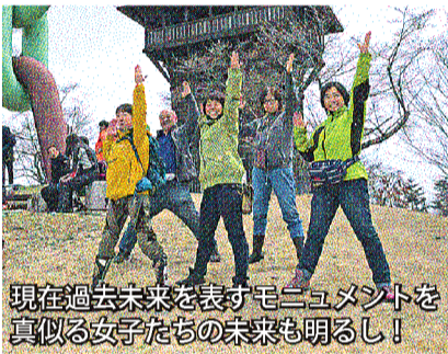
現在過去未来を表すモニュメントを真似る女子たちの未来も明るし！