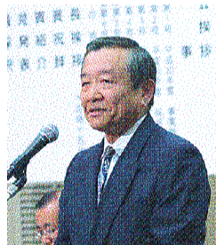
全国道路利用者会議常任理事 汐見明男

【衆議院議員】 あきもと司、伊藤信太郎、伊藤忠彦、井上義久、今枝宗一郎、岩田和親、衛藤征士郎、大隈和英、逢坂誠二、太田昌孝、大西宏幸、小田原潔、金子恭之、神谷昇、神山佐市、亀岡偉民、川内博史、河村建夫、北村誠吾、古賀篤、國場幸之助、左藤章、佐藤英道、重