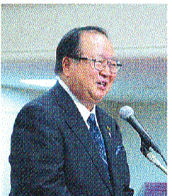
福岡県柳川市長 金子健次