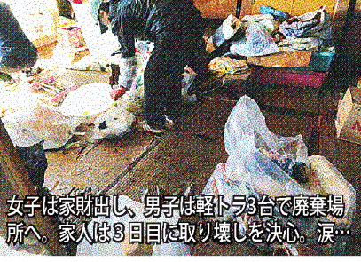
女子は家財出し、男子は軽トラ3台で廃棄場所へ。家人は3日目に取り壊しを決心。涙...