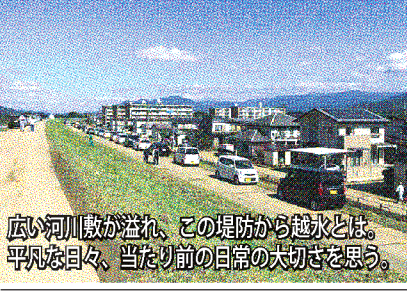
広い河川敷が溢れ、この堤防から越水とは。平凡な日々、当たり前目の日常の大切さを感じる。

「可哀想で落とせないんだよ」と言いながら、もぎったリンゴをひとつひとつ腰を屈めてそとと地面に置く年配のリンゴ農家さん。背丈ほどの泥水に浸かってしまった為、最盛期なのに出荷できないは捨てざるを得ない状況は辛すぎて涙が出てきました。実った食べ物と同じく、大事に育ててきた生活の営みを全て奪い去った台風19号。連続台風で直後にも大雨、そしてその異例なルートで、日本列島に大打撃をもたらしました。 住んでいる松本市の山間の集落でも、河川の氾濫まであと一歩。主要道路はなんとか大丈夫でしたが、四方に向かう細い峠の林道は、何箇所も道がすぼり崩落して多くが通行止め