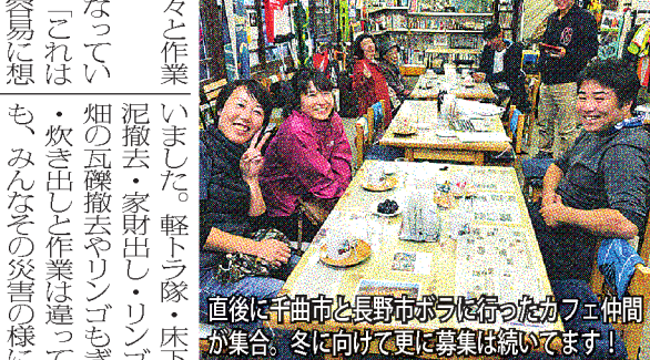
直後に千曲市と長野市ボランティアを行ったカフェ仲間が集合。冬に向けて更に募集は続いています!

「この現場でボランティアしなくて運ばれていきました。これ、洗ったら使えるかも」「記念品みたいな感じが、どうしますか」と、家主の方に聞くものの、泥が普通の泥ではないので、諦めることの連続。いくつかが乾かしていたのは、小さな仏具と位牌だけ。ボランティア5人と家人の仕事仲間と計10数名、淡々と作業をこなしました。