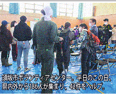
須坂市ポリスチレンセンター。平日のこの日、県内外から186人が集まり、42件をヘルプ。

NETWORK NETWORK NETWORK NETWORK NETWORK NETWORK NETWORK NETWORK NETWORK