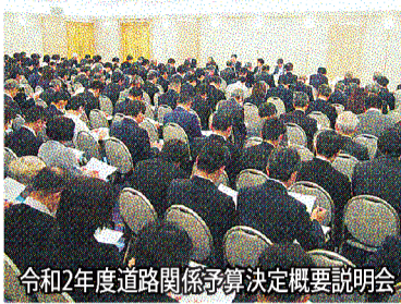
令和2年度道路関係予算決定概要説明会