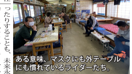
ある意味、マスクにも外テーブルにも慣れてるライダーたち。

都市計画の中の道路(特別編) ポストコロナの都市と街路 東洋大学国際学部・准教授 志摩憲寿