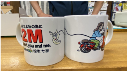
Protect you and me. タンデムシートのヤギも2m離してみました。

現在75名の新型コロナウイルス陽性感染者が出ている長野県では、「新しい生活様式」への移行準備期間となつています。例年、楽しい大型ツーリングイベントがあった5月末は、移行期間。県域をまたいだ移動の自粛は今のところそ