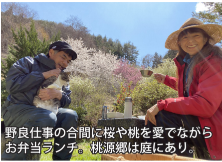
野良仕事の合間に桜や桃を愛でながらお弁当ランチ。桃源郷は庭にあり。

NETWORK NETWORK NETWORK NETWORK NETWORK NETWORK NETWORK NETWORK NETWORK NETWORK