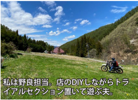
私は野良担当。店のDIYしながらトリアルセクション置いて遊ぶ夫。