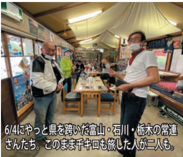
6/4にやっと県を跨いだ富山・石川・栃木の常連さんたち。このまま千キロも旅した人が二人も。

NETWORK NETWORK NETWORK NETWORK NETWORK NETWORK NETWORK NETWORK NETWORK NETWORK