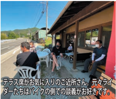
テラス席が気に入りの近所さん。元ライダーたちはバイクの側での談話がお好きです。