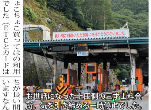
お世話になった上田側の三才山料金所。気を引き締める一時停止でした。

れなりのテクニクを要し、特に松本側の下りはスピードオーバーにならぬよう神経を使います。何度か有料代回避と好奇心から旧道の裏道にチャレンジしようかと思いましたが、ナリで示すルートはきつと後悔しそうな迷路と読み取れ、勇気を出さずに素直にトンネルに吸い込まれてしまいました(これは正解だったようです)。物流のトラックも観光などの一般車も多くて混んでいましたが、ずいっと工事中だった印象がありました。昨年の台風では延長道路で崩落もあつたはずですが、いつも手をかけてくれたので、無料にして大丈夫なのかな?と余計な心配をしていますが、2.5キロのトンネルを含む8.6キロの三才山、普通車520円、軽自動車と二輪車420円はけっこう高く感じ、割引回数券をち よこちよこ買つては利用(ETCとカードは不可)。最近知ったのですが、ライダーの皆さんは、コンビニで通行券を買う時に、暗黙の了解で「セロテープ下さい」「はい、どうぞ」というやりとりがあり、通行券をテープでカウルの内側やタンクに貼って走り、それをきつと渡していたそうです。私はバックから取り出すのがいつも面倒だったので、「受け取る方も慣れていて、よ」と聞いて、最後にそれ、やってみてみよ！ 料金所のスタッフも、めちゃくちゃ感じよかったです。老いも若きもとにかく元気で対応よくて素敵な方ばかりだったので、あの方々と会えないのかと思うとちょっと残念。ニュースでも徴収職の年配者がインタビューされていました。「お客様に長い間ご苦勞様なんていろいろ差し入れて頂いたりして、こっ