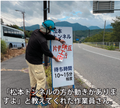
「松本トンネルの方が動きが早いですよ」と教えてくれた作業員さん。

万歳！この9月1日より、我が家からひとつ山の向こう(25キロ30分!)に位置する長野県道路公社が管理する「三才山トンネル」と「松本トンネル」が無料化されました。いずれも主要道路である国道254号にあり、44年前に三才山トンネル、26年前に松本トンネルが完成し、物流や観光に大きく貢献。その恩恵を、田舎暮らしの私もいっぱい受けてきました。改めて数えてみると、7年間で三才山トンネルは50回、松本トンネルは70回(夜間無料も頻りに利用)も利用。これを使うと上田・佐久・群馬方面、松本市内へのアクセスが段違いに楽になるので、無料化は久々の嬉しい道路ニュースでした。 便利と言えども険しい山中(標高千メートル)の三才山区間は、上り下りにそ