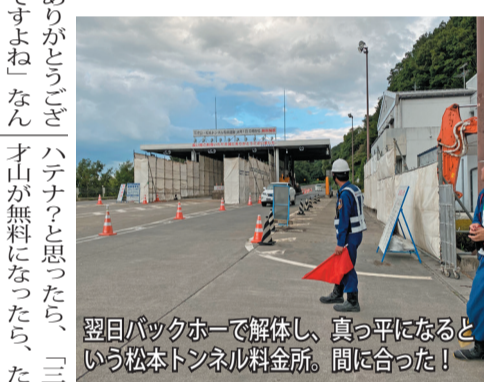
翌日バックホーで解体し、真っ平になるという松本トンネル料金所。間に合った！

ちが長い間ありがとうございました。最近知ったのですが、ライダーの皆さんは、コンビニで通行券を買う時に、暗黙の了解で「セロテープ下さい」「はい、どうぞ」というやりとりがあり、通行券をテープでカウルの内側やタンクに貼って走り、それをきつと渡していたそうです。私はバックから取り出すのがいつも面倒だったので、「受け取る方も慣れていて、よ」と聞いて、最後にそれ、やってみてみよ！ 料金のスタンプも、め