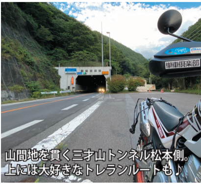
山間地を貫く三才山トンネル松本側。上には大好きなトレランルートも！

NETWORK NETWORK NETWORK NETWORK NETWORK NETWORK NETWORK NETWORK NETWORK NETWORK