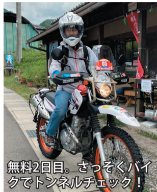
無料2回目。さっそくバイクでトンネルチェック！

万歳！この9月1日より、我が家からひとつ山の向こう(25キロ30分!)に位置する長野県道路公社が管理する「三才山トンネル」と「松本トンネル」が無料化されました。いずれも主要道路である国道254号にあり、44年前に三才山トンネル、26年前に松本トンネルが完成し、物流や観光に大きく貢献。その恩恵を、田舎暮らしの私もいっぱい受けてきました。改めて数えてみると、7年間で三才山トンネルは50回、松本トンネルは70回(夜間無料も頻りに利用)も利用。これを使うと上田・佐久・群馬方面、松本市内へのアクセスが段違いに楽になるので、無料化は久々の嬉しい道路ニュースでした。 便利と言えども険しい山中(標高千メートル)の三才山区間は、上り下りにそ