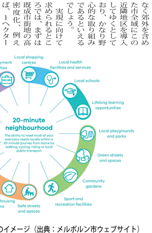
図 「20分の近隣地区」のイメージ

正当化してしまうと、とても危険な状況になってしまっているのではと心配してしまいます。 働き方改革、暮らし方改革が現実のものとして進みつつあり、移動と言う面では、マイカー利用が確実に増え続け、都市部の通勤も自転車や小型バイクが増えています。つまり路上の個体数が増えているわけですから、一層のルール厳守、モラルが問われています。そうそう、レジ袋が有料になり、エコバッグ活躍ですが、遠いあの頃、母や近所のおばちゃんか下げていた「買い物かご」は、何処