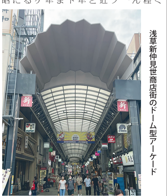
浅草新仲見世商店街のドーム型アークード

都市計画の中の街路(36) アークード空間の賑わい(その3) 東洋大学国際学部・准教授 志摩 恵寿 アークード空間の賑わい(その3) 東洋大学国際学部・准教授 志摩 恵寿 昭和5年に浅草松屋が開業したように生み出されるアークード空間。昭和23年には浅草松屋が改装された。昭和23年には浅草松屋が改装された。昭和23年には浅草松屋が改装された。