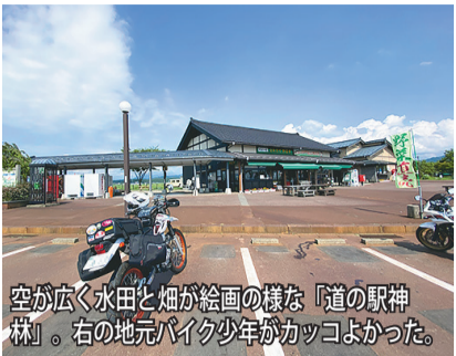
空が広く水田と畑が絵画の様な「道の駅神林」。右の地元バイク少年がカッコよかった。

NETWORK NETWORK NETWORK NETWORK NETWORK NETWORK NETWORK NETWORK NETWORK NETWORK NETWORK