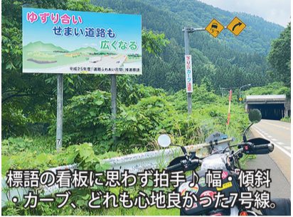
ゆずり合い せまい道路も 広くなる 標語の看板に思わず拍手♪ 幅・傾斜・カーブ、どれも心地良かった7号線。