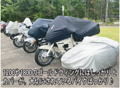
1200や1800のゴールドウイングにはしっかりとカバ―が、大切にされているバイクばかり♪

4月に続いて「OSTC 60歳からのツーリングクラブ」夏ツーリングに行ってきた。山形県鶴岡市の湯野浜温泉で集合したのですが、日本は何周もしているの自負している私に「何故か走っていない」といわれた。鶴岡から秋田まで、新潟から60キロほど離れたところまで、海岸線がすぼり抜けていました。19歳の日本人一周時、男鹿半島滞在中に「スポーツランドSUGO」のモトクロスレースに有名海外選手が来ると聞き、急遽道路変更して宮城県へ。その後月山の麓まで戻ったのですが、「またいつでも来られるし」と思っていたので、酒がテーマとなりました。