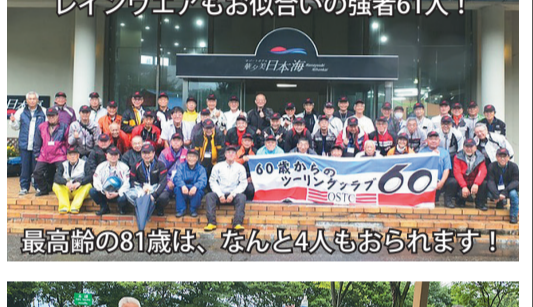
レインウェアもお似合いの強者61人！ 最高齢の81歳は、なんと4人もおられます！