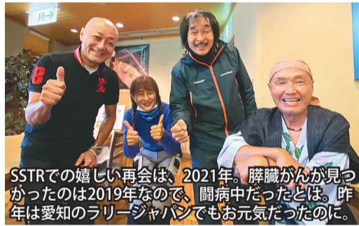
SSTRでの嬉しい再会は、2021年。膵臓がんが見つかったのは2019年なので、闘病中だったとは。昨年は愛知のラリー・ジャパンでもお元気だったのに。