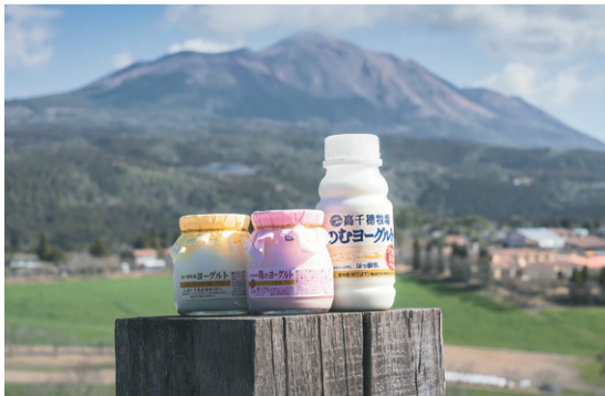
高千穂牧場では新鮮な乳製品も味わえる