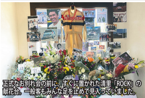
正式なお別れ会の前に、すぐに置かれた清里「ROCK」の献花台。一般客もみんな足を止めて見入っていました。

NETWORK NETWORK NETWORK NETWORK NETWORK NETWORK NETWORK NETWORK NETWORK NETWORK