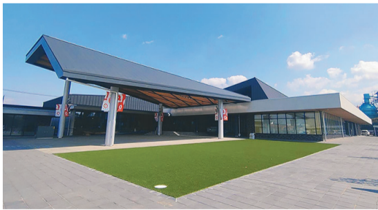
生まれ変わった道の駅「都城NiQLL」

かな自然の中で動物たちとのふれあいや食事などが楽しめず。都城に移住者が増えている理由は、市の施策もあるでしょうが、豊かな自然環境が大きいのではないかと、年間を通じて温暖で過ごしやすい、畜産や農業が盛んで、豊富な地下水で仕込む焼酎も特産品となっています。そういえば都城大弓も、弓に適した真竹やハゼといった自然素材を求めて、都城に弓師たちが落ち着いたと聞きました。豊かな自然が都城を支えているのだ。