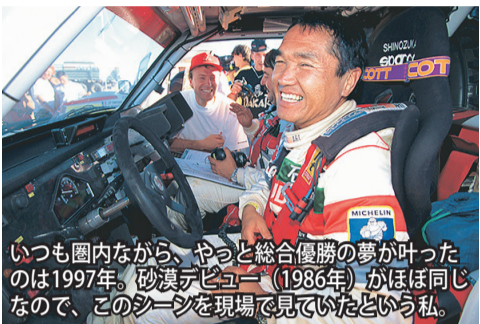
いつも園内ながら、やっと総合優勝の夢が叶ったのは1997年。砂漠デビュー(1986年)がほぼ同じなので、このシーンを現場で見ているという私。