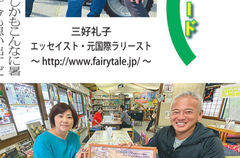
藤原ハバ&ママを囲むトライアルライダーの息子二人。飛び石で顔を損傷しながらも走った僕も。難所では全員で誘導ボードしたそうです。