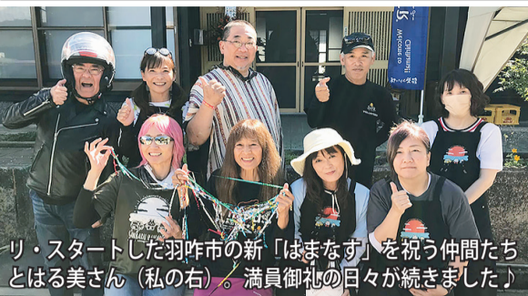
り・スタートした羽咋市の新「はまなす」を祝う仲間たちとはる美さん(私の右)。満員御礼の日々が続きました♪

NETWORK NETWORK NETWORK NETWORK NETWORK NETWORK NETWORK NETWORK NETWORK NETWORK