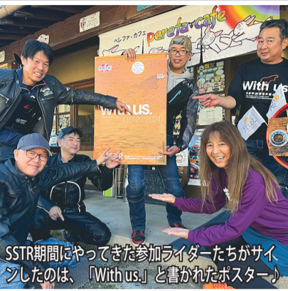
SSTR期間にやってきた参加ライダーたちがサインしたのは、「With us.」と書かれたポスター♪

お正月からハロウィンまでの「サンライズセット ツーリングラリー」は、コロナ禍でもなんとか形を... (Main article text continues, discussing motorcycle culture and community support.)