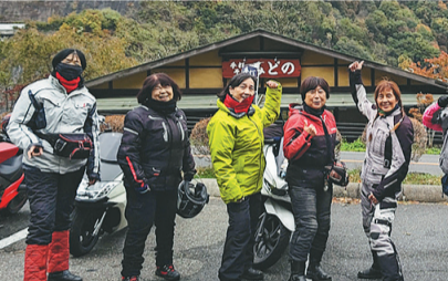
スタートは道の駅「風穴の里」。介護士、美容師、カメラマン、主婦と様々な人が、走るのが楽しくて仕方ない女子たち。全然寒くないのがコワイ!!