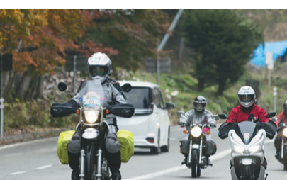
平湯は濃霧だったけれど、バックミラーに映るみんなを見ながら走るの楽しいな。たった230キロだけだけど、笑っぱなし。