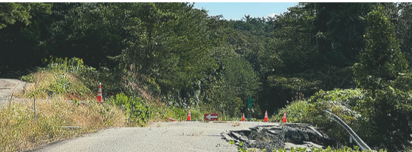
延々と片側落ちしていたピースへの道。酷いのは可哀想で撮れず、写真は1枚のみ。でも、その後ボランティア団体では「奥能登の現状を(常識の範囲で)広めて欲しい」と変わってきていることを知る。