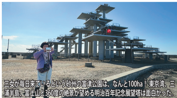
三女が毎日来ているという砂州の富津公園は、なんと100ha! 東京湾、三浦半島、富士山と360度の絶景が望める明治百年記念展望塔は面白かった。