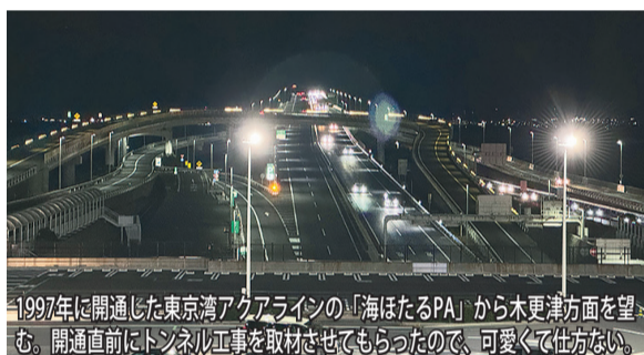
1997年に開通した東京湾アクアラインの「海ほたるPA」から木更津方面を望む。開通直前にトンネル工事を取材させてもらったので、可愛くて仕方ない。