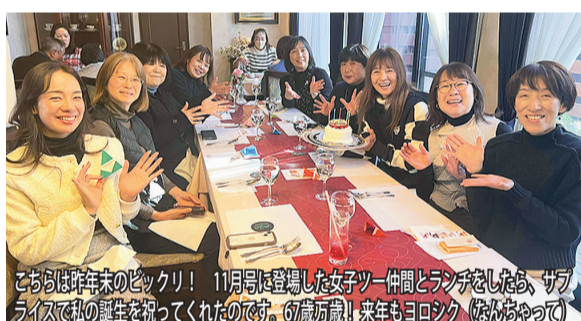
こちらは昨年末のピクニック! 11月号に登場した女子ツー仲間とランチをしたあ、サブライズで私の誕生日を祝ってくれたのです。6歳万歳! 来年もヨロシク (はらあやっ)

「お宿なかにし」の前に広がる太平洋の朝焼けは、もうそれだけで癒し。指差すは17年も毎日眺めた富士山。写真：佐々木江美 「お宿なかにし」の前に広がる太平洋の朝焼けは、もうそれだけで癒し。指差すは17年も毎日眺めた富士山。写真：佐々木江美 「お宿なかにし」の前に広がる太平洋の朝焼けは、もうそれだけで癒し。指差すは17年も毎日眺めた富士山。写真：佐々木江美