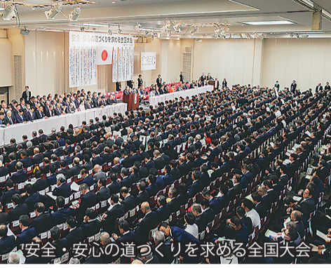
安全・安心の道づくりを求める全国大会